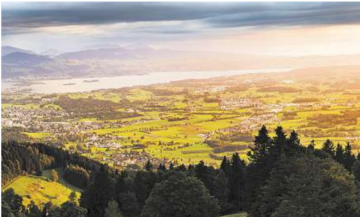
Das Zürcher Oberland im Zentrum: zuerioberland24.ch