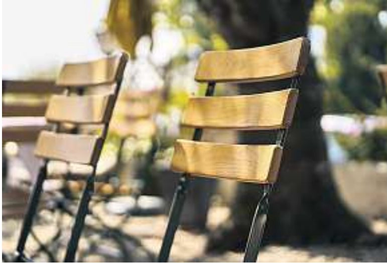
Terrassen in Gossau grösstenteils offen.