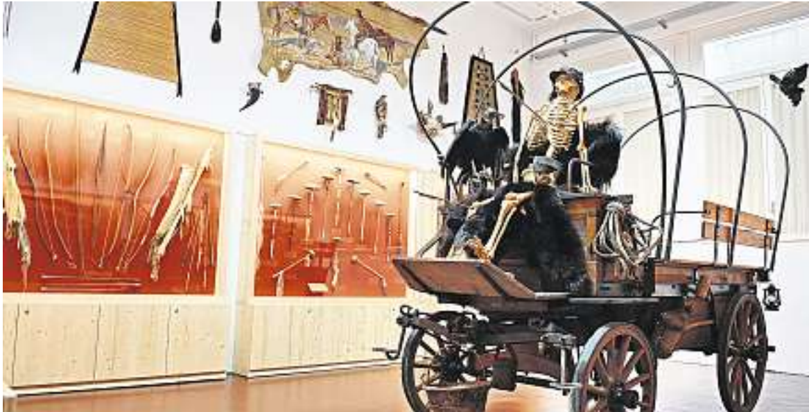
Die Waffenkammer zeigt u. a. berühmte Winchester-Gewehre.