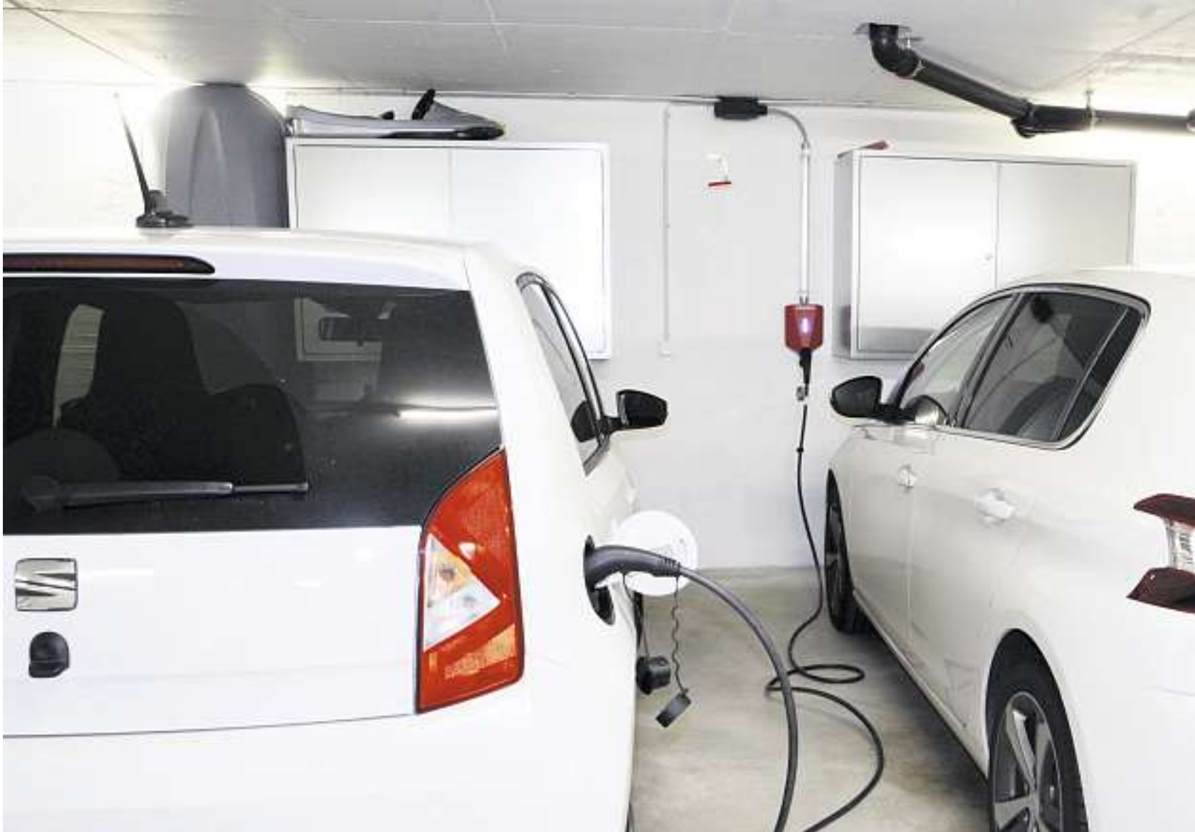
Komplexer als man denkt: Ladestationen in Gemeinschaftsgaragen.

Immer mehr Menschen entscheiden sich beim Kauf eines neuen Autos für eine elektrische Variante. Neben E-Tankstellen braucht es auch eine Lademöglichkeit in der Garage. Wir wollten von Elektrofirmen und Liegenschaftsverwaltern wissen, was es für eine solche Installation braucht und welche Gefahren es aus Sicht der Feuerwehr gibt.