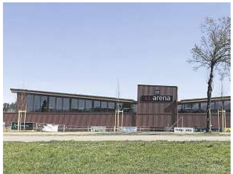
Die Gossauer Halle trägt den Namen «AL Arena».