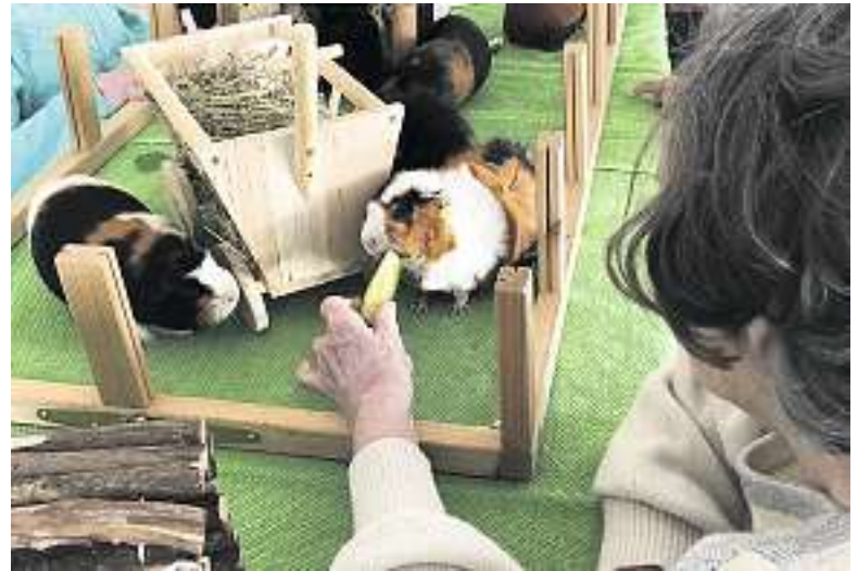
Die Tierbesuche machen viel Freude.

Die Fasnacht wurde in der Schweiz abgesagt – im Grüneck konnte sie jedoch stattfinden. Musik, Tanz und feines Fasnachts-Gebäck erinnerten viele an frühere Zeiten. Wer