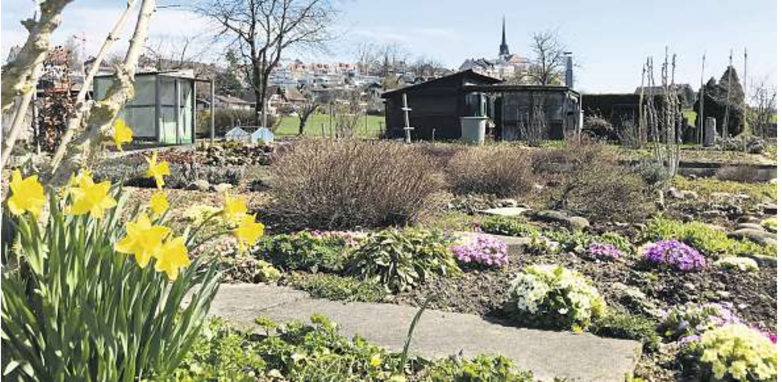
Gartenoase in Gossau: der Schrebergarten Unterdorf