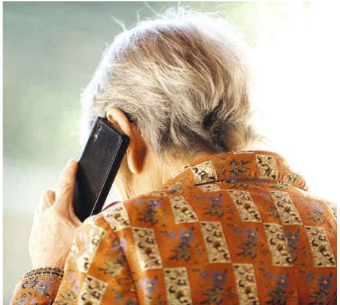
Gerade ältere Menschen werden von Schockanrufen völlig verunsichert. (Symbolbild)

Beim Lesen von Medienberichten zum Thema denken wohl viele: «Das ist doch klar, dass das ein