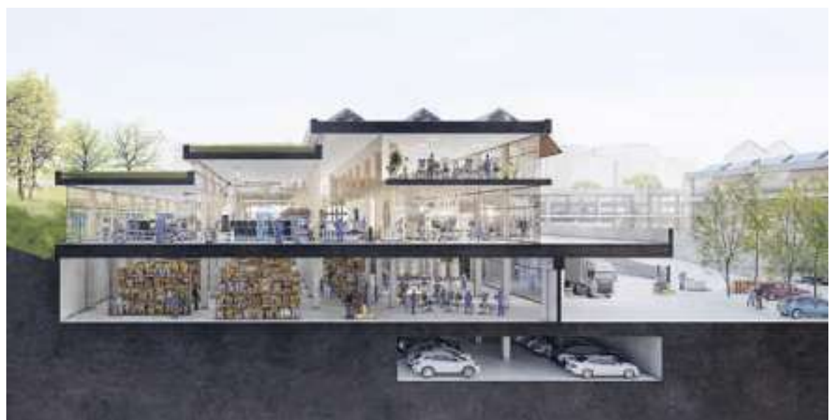
Es sind zwei befahrbare Ebenen geplant.