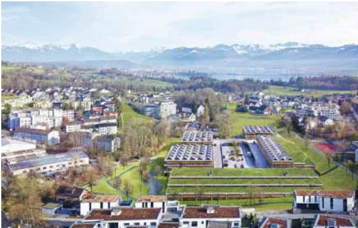
Das geplante OakTec-Areal im Eichtal.