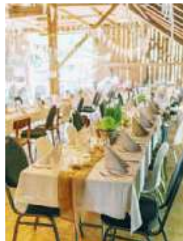
Die umgebaute Scheune bietet Platz für bis zu 150 Gäste.

Die künstlerisch-rustikale Event-Location in der Scheune wird nun auf den Sommer 2023 fertiggestellt