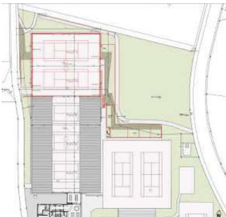
Die Hallenerweiterung würde Raum für zwei weitere Plätze bieten.