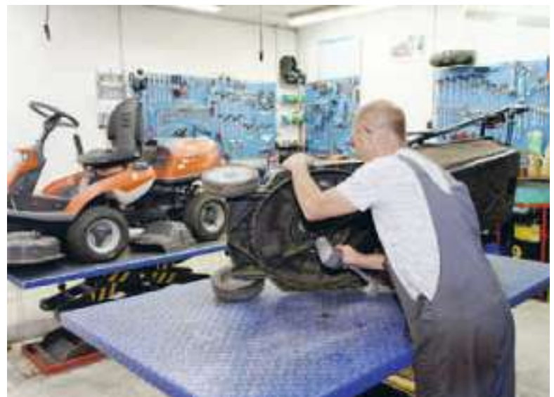
In der Werkstatt in Feldbach werden Reparaturen aller Marken durchgeführt.