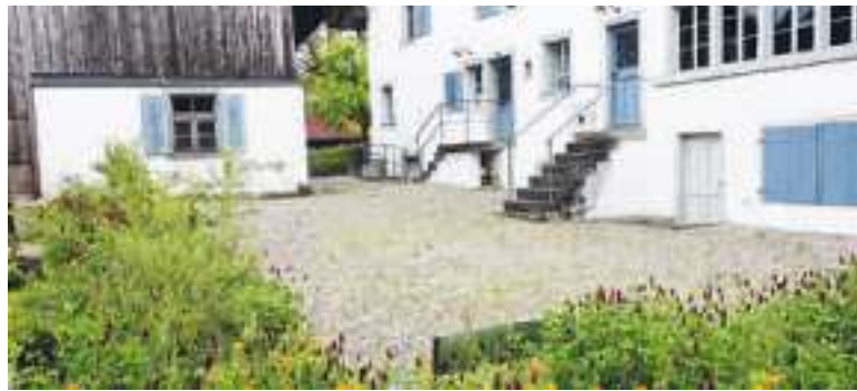
Der Innenhof des Museums wird mit einer Sitzgruppe aufgewertet.

Der Hofraum des Museums im Langenriet wird durch eine künstlerisch gestaltete Sitzgruppe weiter aufgewertet. Sie wurde von vier Kunstschaffenden als Gemeinschaftswerk erschaffen. Am 16. Juni lädt die Stiftung zur Einweihung.