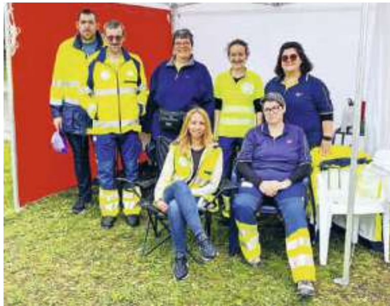
Der kleine, aber feine Samariterverein Hombrechtikon.

Zu den Hauptaufgaben des Samaritervereins gehört – nebst der Erster-Hilfe-Leistung – auch die Schulung der Bevölkerung und Einsätze bei Veranstaltungen zu leisten. So bietet der Verein beispielsweise Nothelferkurse, Zielgruppenkurse und Kleinkinder-Nothilfekurse an.