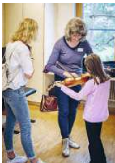
Die Kinder konnten verschiedene Instrumente ausprobieren.