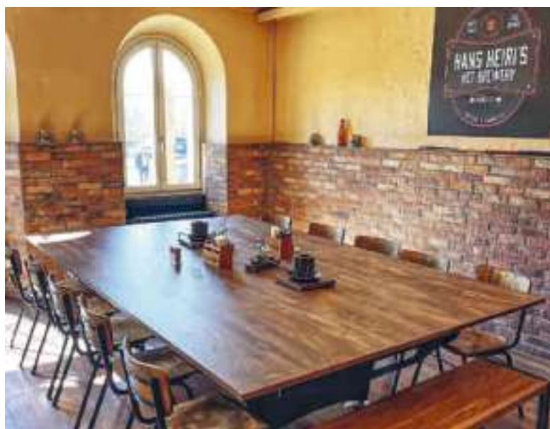
Am Stammtisch erzählt man sich gerne Geschichten aus alten Zeiten und plaudert über Aktuelles.