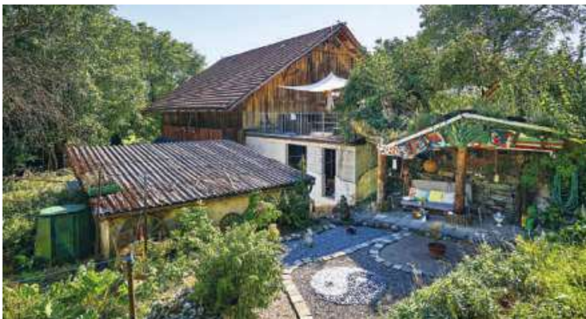
Die Räumlichkeiten können auch für Veranstaltungen gemietet werden.