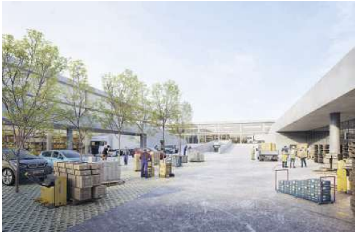
Zufahrt und Anlieferung finden im Innenhof statt.

Das Projekt soll in Regelbauweise realisiert werden. «Es erfüllt ohne Ausnahme die Anforderungen der Bau- und Zonenordnung», betont Belart. «Wir haben uns sogar selbst