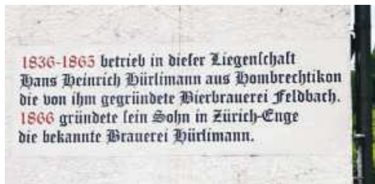
Ein Schriftzug an der Fassade weist auf die Geschichte des Gebäudes hin.