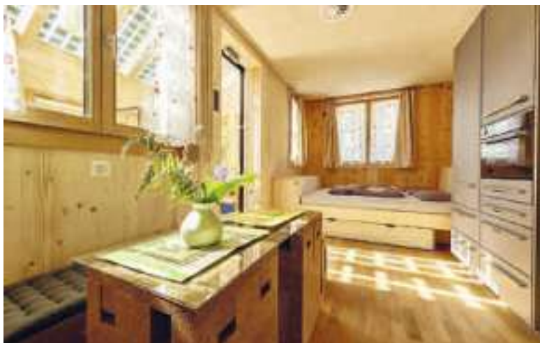
Im KREIS-Haus, einem Forschungsprojekt der ZHAW mit dem Verein Synergy Village, kann man übernachten.