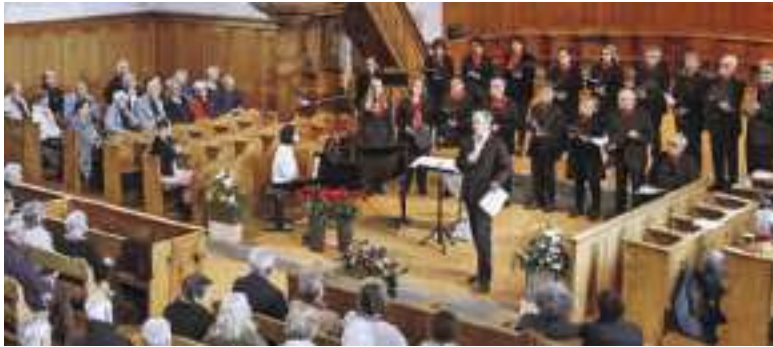
Der Chor der Operettenbühne Hombrechtikon ist bereit für die Premiere.

Orpheus in der Unterwelt 2. September - 7. Oktober 2023 Gemeindsaal Blatten Hombrechtikon www.operette-hombrechtikon.ch