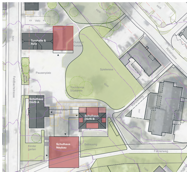
Auszug aus der Machbarkeitsstudie. Bild: häberli heinzer steiger architekten

Bei der Machbarkeitsstudie zur Erweiterung des heutigen Schulareals Neues Dörfli wurden zwei Varianten erarbeitet. Derjenigen Variante, die das Projektteam favorisierte, stimmten Schulpflege wie auch der Gemeinderat zu. An der Infoveranstaltung vom