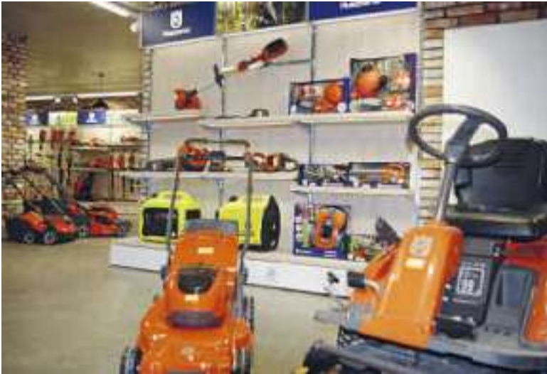
Der neue Showroom.