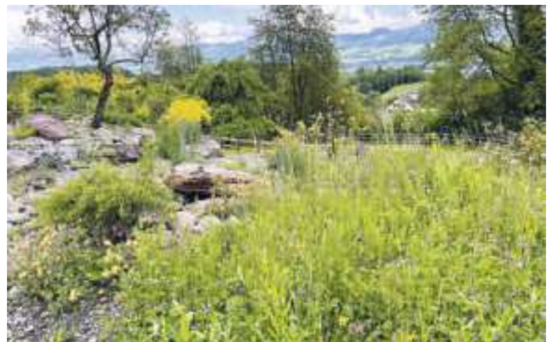
Im eigenen Garten hat Pollastri auch Strukturen für Kleinstlebewesen geschaffen.