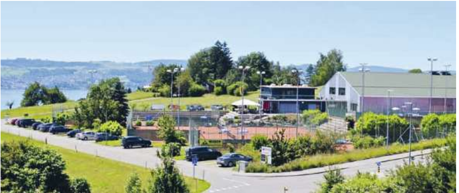
Der Tennisclub Frohberg in Stäfa. (Archivbild)