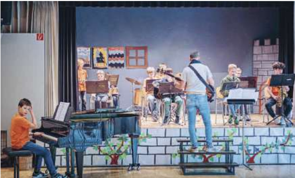
Am Besuchsmorgen musizierten auch junge Musikkünstler der JMOZ.