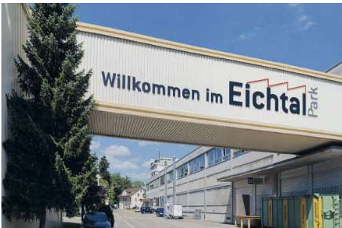
Der Eichtal Park wächst: Auf 2026 entsteht im westlichen Teil ein neuer Business-Standort (Archivbild).

Rütistrasse 7A 8634 Hombrechtikon Telefon 055 254 25 29 info@florhof-getraenke.ch www.florhof-getraenke.ch