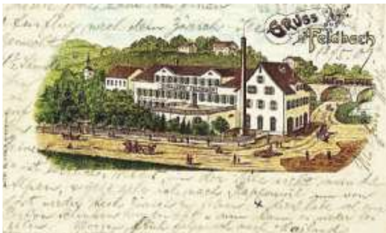
In Feldbach wurde einst Hürlimann-Bier gebraut.