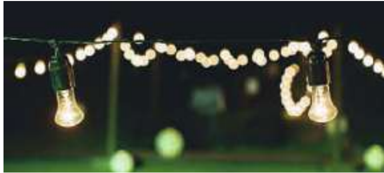
Am zweiten Juli-Wochenende wird gefeiert und getanzt. (Symbolbild).

Bereits seit 1909 führt der Turnverein Hombrechtikon das Waldfest durch – ein Openair-Anlass auf der Seeweidhöhe an der Hauptstrasse zwischen Hombrechtikon und Oetwil am See. Am Wochenende vom 7. und 8. Juli 2023 ist es nun wieder so weit. «Wir haben keine Mühe gescheut, um allen Festbesuchenden zwei unvergessliche Sommerabende auf der Seeweidhöhe bei Musik und Tanz und